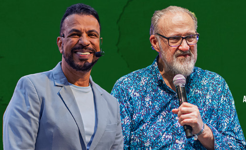
AP. JOHN KELLY